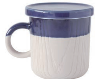
lid mug seaside