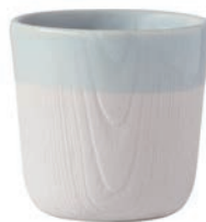
tea cup cloud

磁器 / W123 × D90 × H95mm, 400ml seaside (501043519000 JAN:4573237019535)