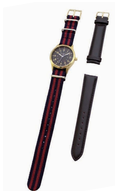
gd/br ナイロンベルト: nv/bgd 革ベルト: br