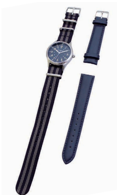
sv/nv ナイロンベルト: nv/gy 革ベルト: nv