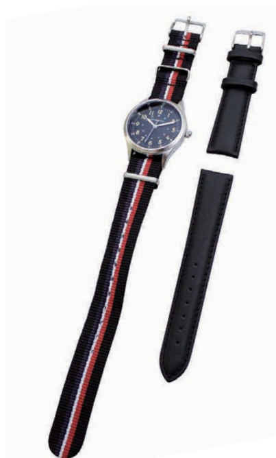
sv/bk ナイロンベルト: bk/bl/rd 革ベルト: bk